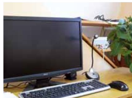
Obec Dřešín / Obecní bezdrátový rozhlas Dřešín / 676 513 Kč / 514 134 Kč