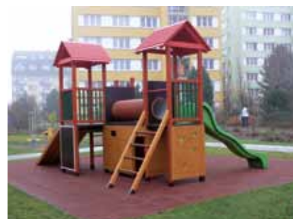
Město Strakonice / Rekonstrukce venkovního areálu Mateřské školy Stavbařů / 1 834 461 Kč / 1 375 846 Kč