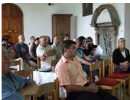
Jednání představitelů členských obcí svazku