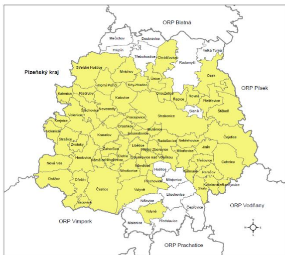
Obrázek 4 Území MAS Strakonicko, z.s. - NUTS3 pro období 2021 - 2027