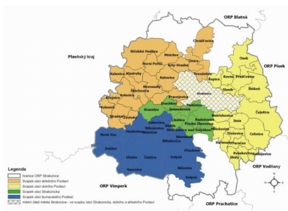
Obrázek 3 Území MAS Strakonicko, z.s. - NUTS2 pro období 2021 - 2027