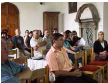
Jednání představitelů členských obcí svazku