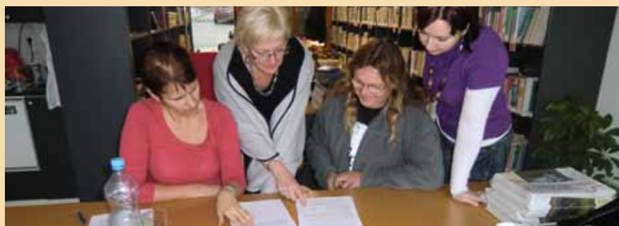
Záběr na pracovní skupinu přípravné fáze nového projektu

Díky úspěšně probíhající spolupráci na právě realizovaném projektu všichni vítají další možnosti využití regionální značky, těší se na další přípravné schůzky a věří, že se projekt podaří dotáhnout ke schválení. Je vidět, že spojené úsilí MAS zapojených do projektů Spolupráce přináší nové možnosti. Neméně důležitý je fakt, že i MAS nevybrané k realizaci SPL mohou uplatnit své náměty a prožívat období příprav i následné realizace projektů, které přinášejí radost ze zajímavé práce a prospěch celému regionu.