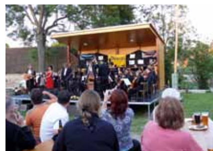
Svazek obcí Dolního Pootaví / Vyba- vení pro pořádání společenských akcí v mikroregionu / 591 617 Kč / 447 645 Kč