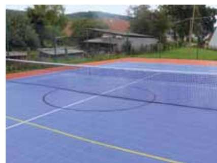
Obec Strunkovice n. Volyňkou / Zkvalitnění sportoviště v obci Strunkovice nad Volyňkou / 736 274 Kč / 551 070 Kč