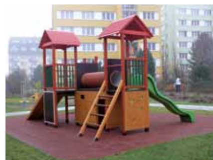
Město Strakonice / Rekonstrukce venkovního areálu Mateřské školy Stavbařů / 1 834 461 Kč / 1 375 846 Kč