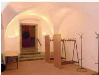
Město Volyně / Pošumavská tržnice (tradice, kvalita, zručnost, nápady) / 2 250 751 Kč / 1 702 248 Kč