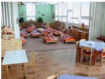
Městys Katovice / Pohádková proměna MŠ v Katovicích – stavební úpravy a nové vybavení tříd a prostor / 469 234 Kč / 318 217 Kč