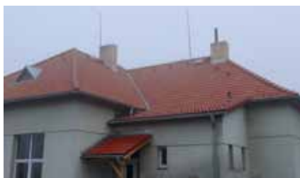
Obec Zvotoky / Rekonstrukce střechy víceúčelového zařízení v obci Zvotoky / 837 900 Kč / 394 960 Kč