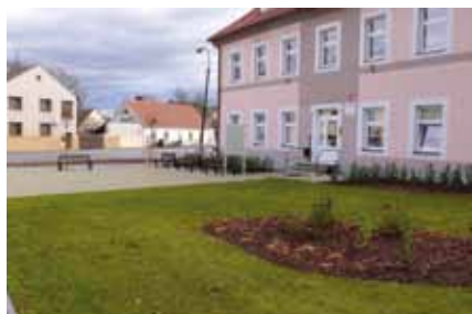
Obec Střelské Hoštice / Úprava veřejného prostranství před ZŠ Střelské Hoštice / 615 090 Kč / 435 177 Kč