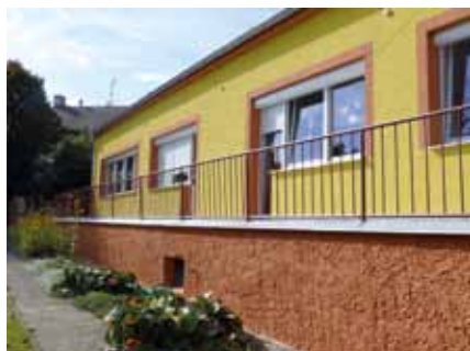
Obec Novosedly / Školka v novém kabátě – modernizace objektu mateřské školy Novosedly / 1 770 891 Kč / 1 323 776 Kč