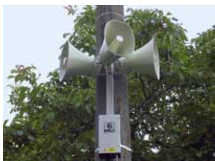
Obec Chrástovice / Rekonstrukce obecního rozhlasu / 357 900 Kč / 268 425 Kč