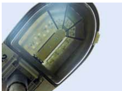
Obec Pracejovice / Rekonstrukce veřejného osvětlení / 534 124 Kč / 400 592 Kč

ZADATEL / NÁZEV PROJEKTU / CELKOVÉ NÁKLADY (v Kč) / DOTACE (v Kč)