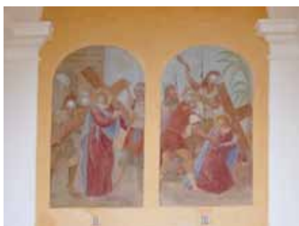
Římskokatolická farnost Čestice / Rekonstrukce poutních kaplí na vrchu Kalvárie v Česticích / 529 960 Kč / 476 964 Kč